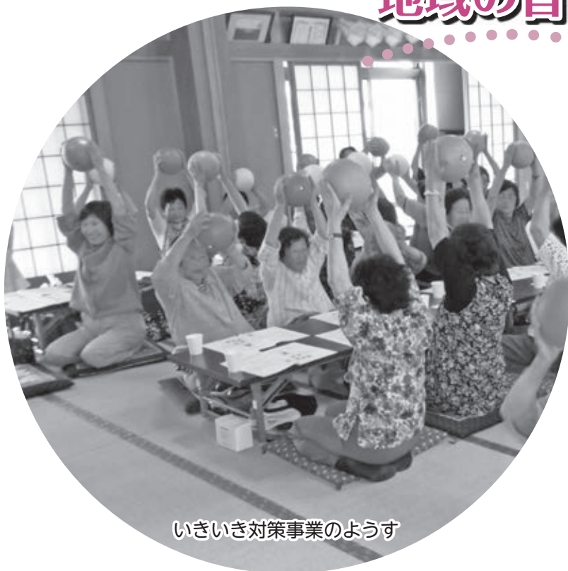
いきいき対策事業のようす